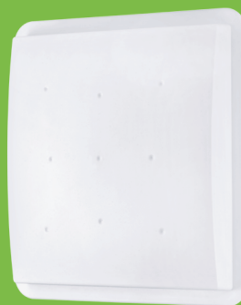
UHF Serie 5