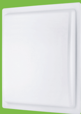
UHF Serie 10